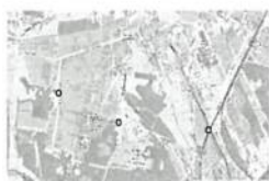
zgierz1.png 714 KB

oraz https://ekologiczna-lodz.blogspot.com/